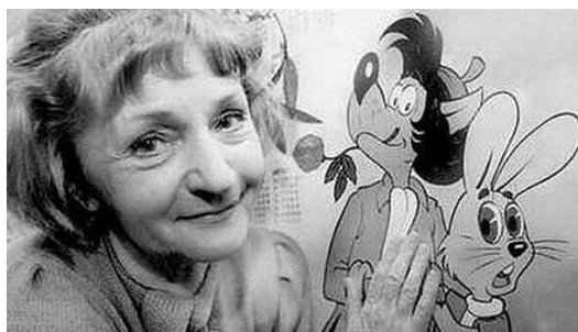
Клара Михайловна Румянова