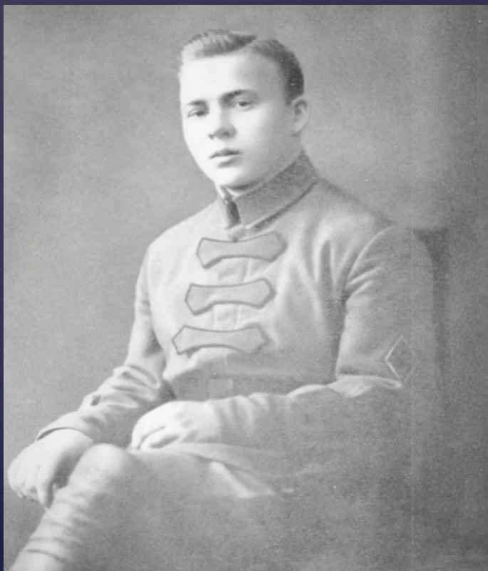
Аркадий Гайдар 1922 год

Первым его произведением была повесть «В дни поражений и побед». Однако после её выпуска в свет, тираж не был раскуплен. В 1926 году была написана повесть «Р.В.С.». Сам писатель признал её началом настоящей литературы для детей.