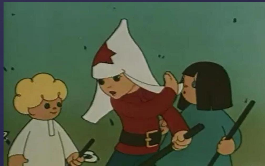
«Сказка о Мальчише-Кибальчише», мультфильм 1958 года