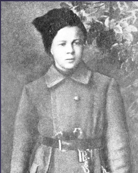
Аркадий Гайдар 1918 год