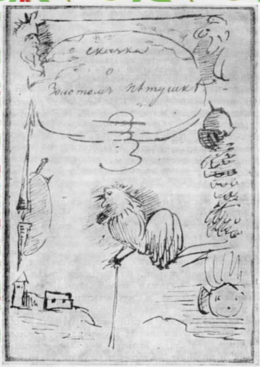
Рисунок А. С. Пушкина