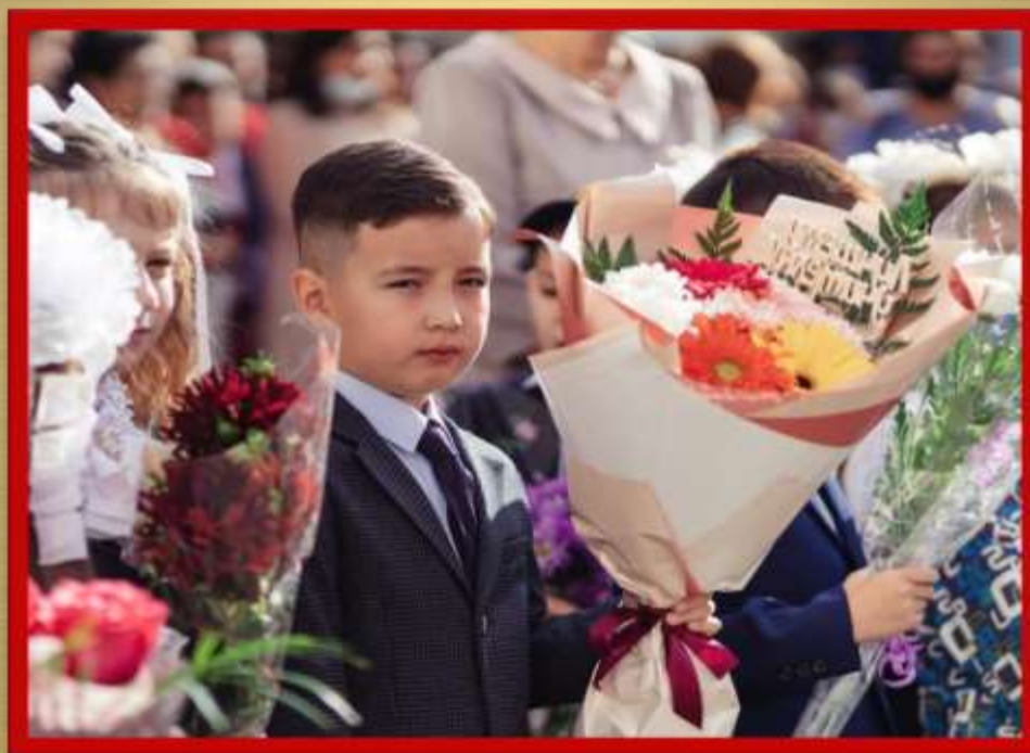
Первая школьная линейка.